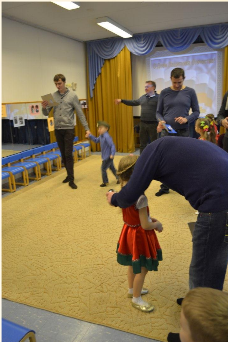
Дети поздравляют своих пап.