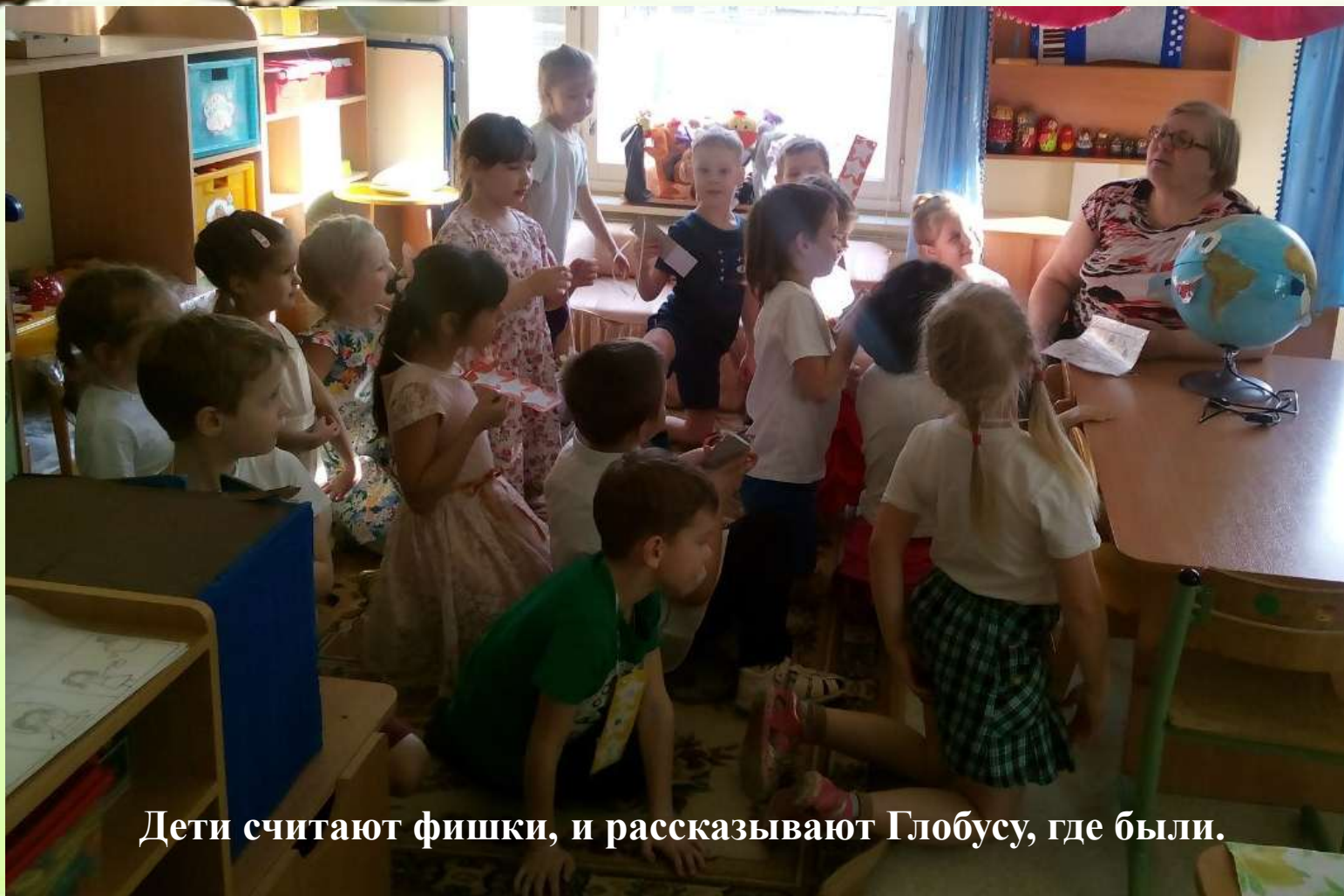
Дети считают фишки, и рассказывают Глобусу, где были.