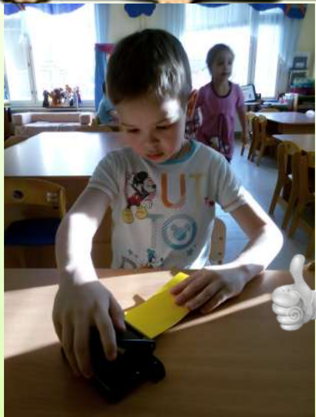
Сделаю отверстия для ленточки