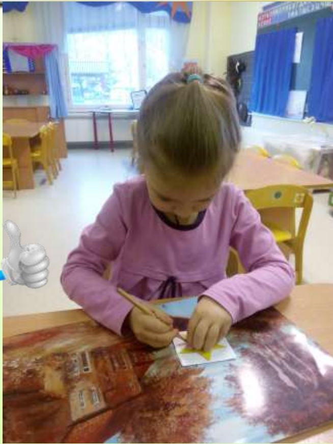
Нарисую эмблему нашей группы «Звездочки»