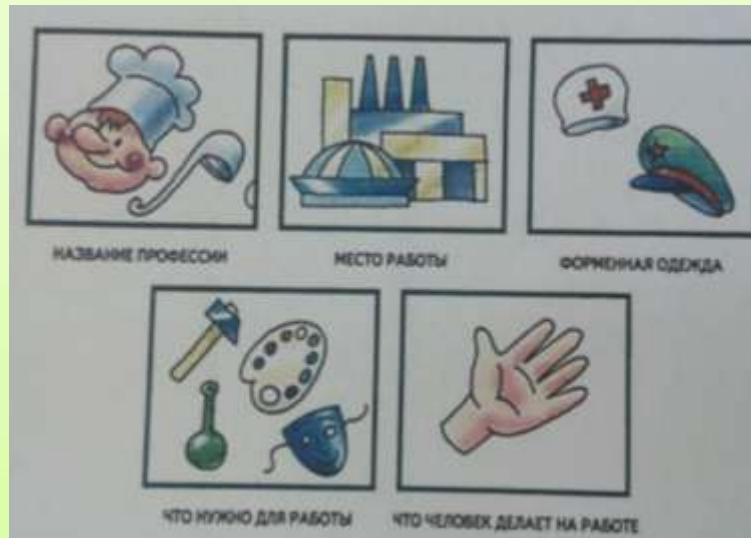
Таблица для составления рассказа.

Дети рассказывают Глобусу о своих впечатлениях.